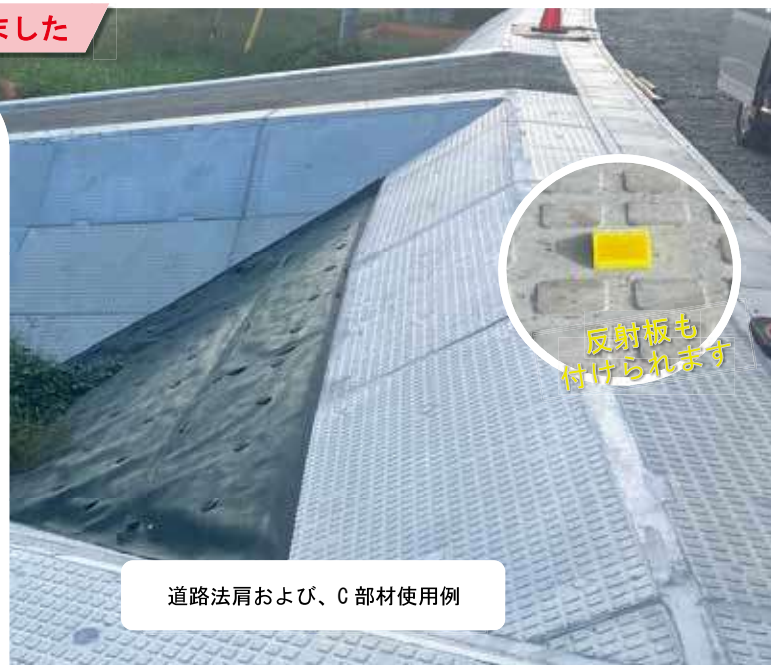
道路法肩および、C部材使用例