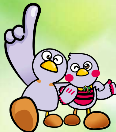
埼玉県のマスコット 「コバトン」「さいたまっち」